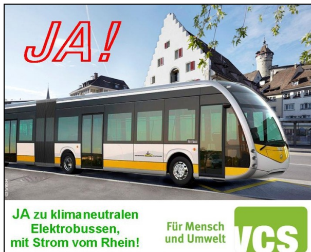
Originalgrösse 143x120 mm

Für den VCS war das Projekt eine wichtige Angelegenheit. Wir haben das JA-Komitee finanziell kräftig unterstützt und zudem in der Schaffhauser AZ und den Schaffhauser Nachrichten je zwei Inserate geschaltet.